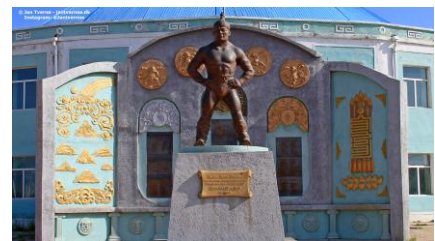
Foto er taget i Mongoliet og viser indgangen til brydestadion i Mörön.