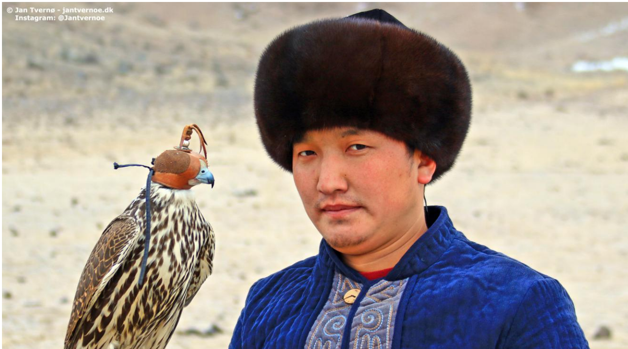
Den stærke identitet som nomade lever videre på de centralasiatiske stepper.