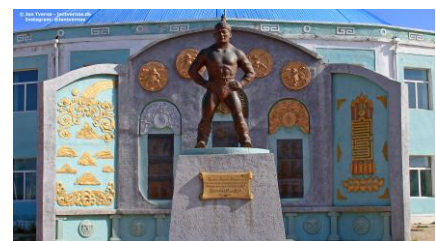
Foto er taget i Mongoliet og viser indgangen til brydestadion i Mörön.