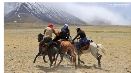
Foto er taget i Afghanistan og viser den traditionelle nomadesport Buzkashi.